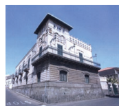
Fondazione Dott. Alfio La Spina