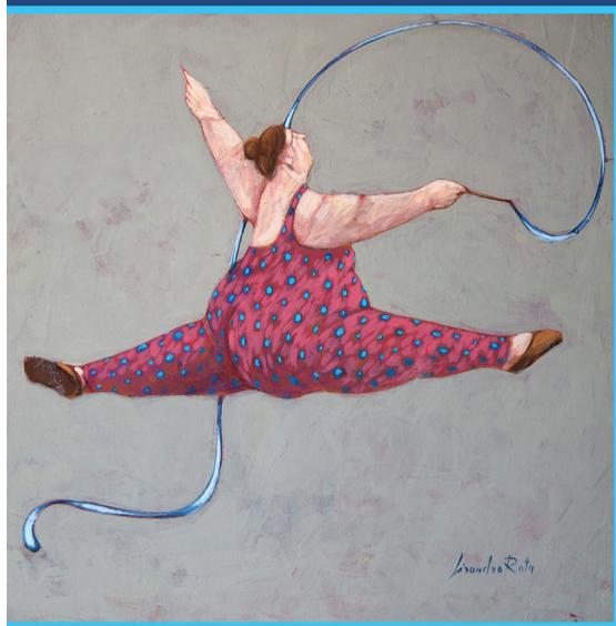
Lisandro Rota, "Ginnastica ritmica 1", www.lisandrrota.it

MESSINA, 8 GIUGNO 2019 • CAPO PELORO RESORT